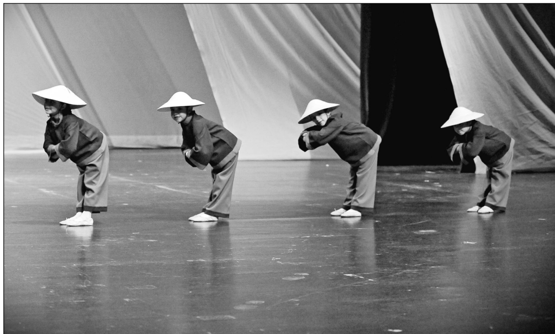
"Danza del té"