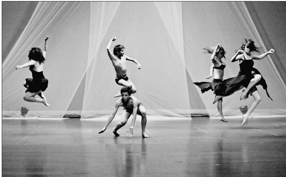
"6 grados de separación", de Diego Cervantes