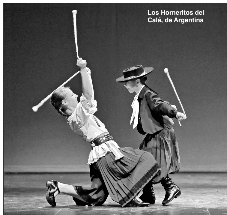
Los Horneritos del Calá, de Argentina