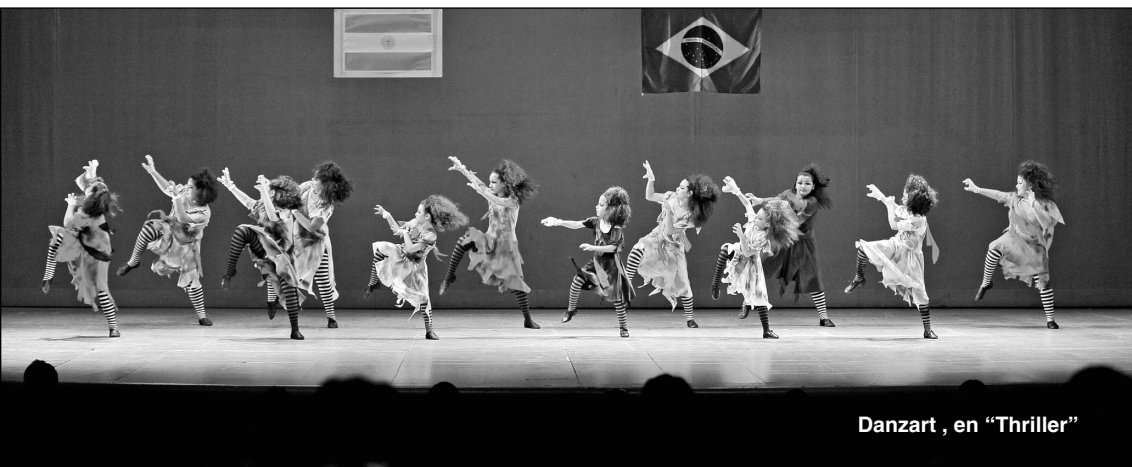
Danzart, en “Thriller”