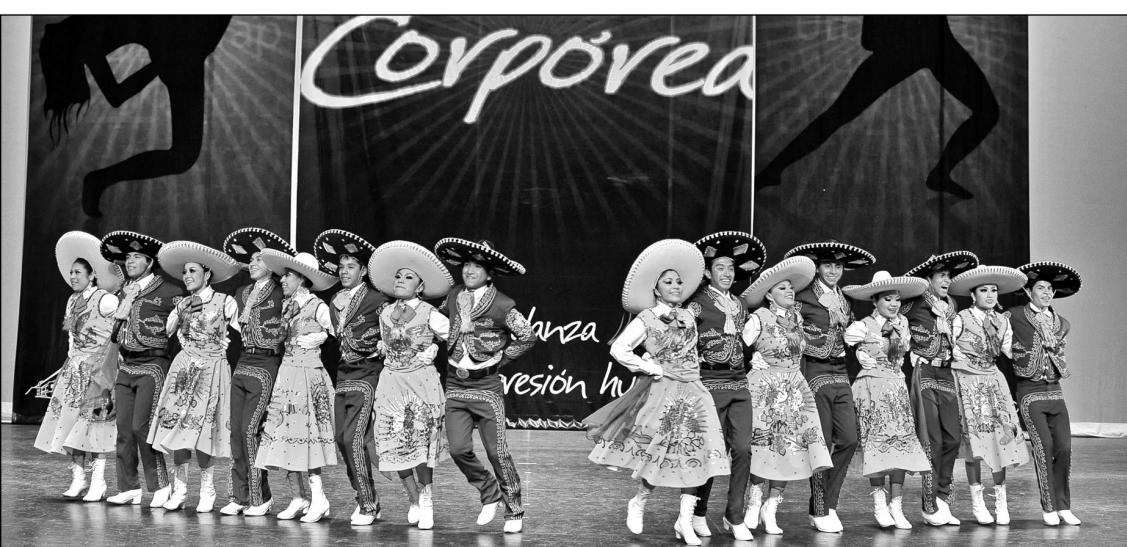
Compañía Infantil y Juvenil de Danza Folklórica del H. Ayuntamiento de Atizapán de Zaragoza