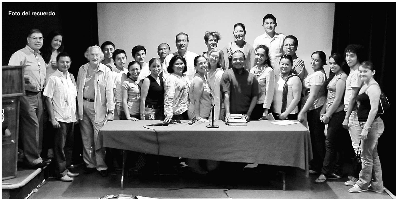
Foto del recuerdo