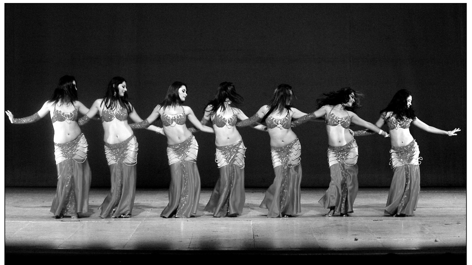
Escuela de danza Zenzontle de Campeche