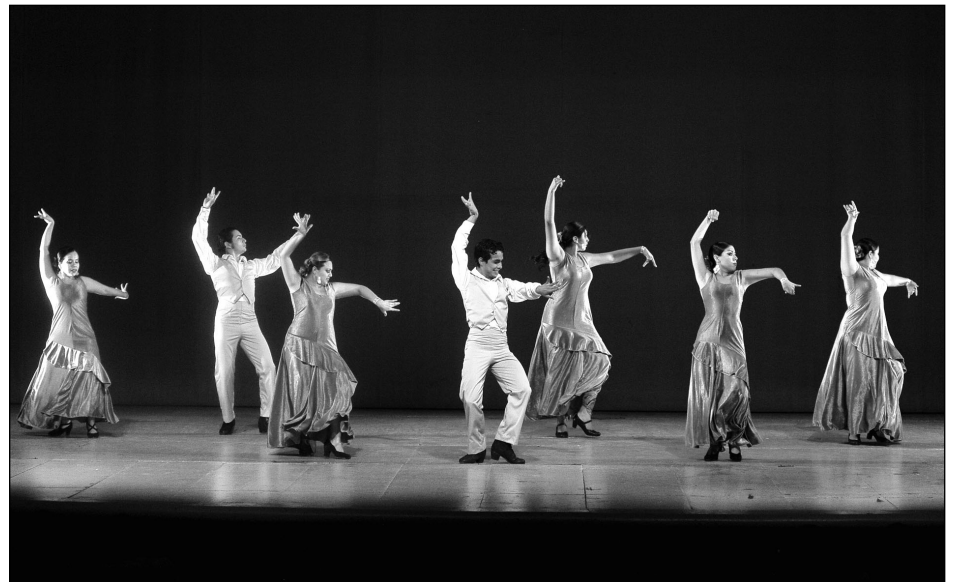
Compañía Española de Danza Rioja