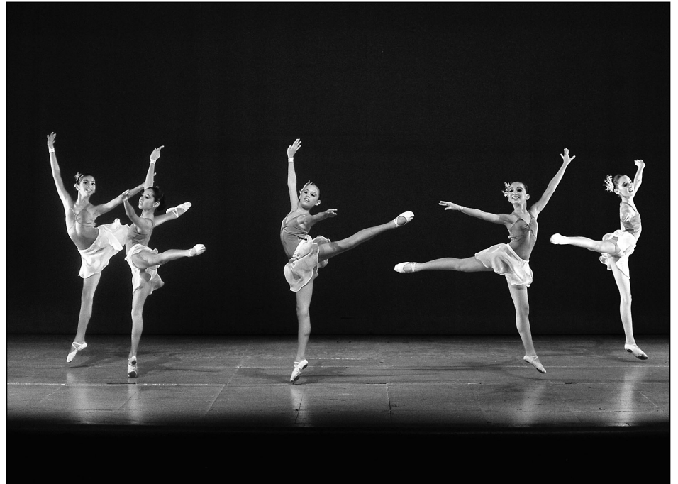
Centro Estatal de Bellas Artes